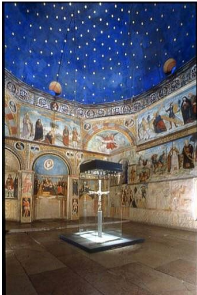
Croce del Desiderio