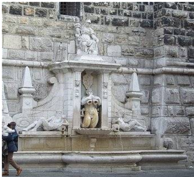
Fontana della Pallata

Si ammireranno le testimonianze più importanti: Vittoria Alata, San Salvatore, Coro delle Monache, S. Maria in Solario e la Croce del Desiderio .