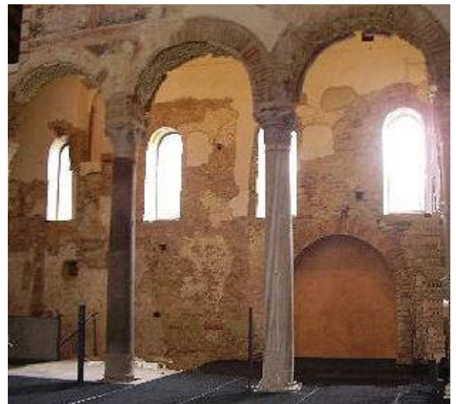
Complexo di Santa Giulia

Verso le ore 18 rientro all'Agriturismo al Rocol, che ci delizierà con degustazione di vini della Franciacorta.