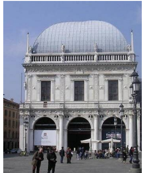
Palazzo della Loggia

Alle 15,30 visita al Museo di S. Giulia, inserito per alcuni ambienti tra i siti Unesco dal 2011.